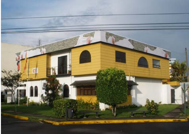
Edificio de El Farolito , sede de la OTC y del Centro Cultural de España

Las relaciones entre España y Costa Rica se caracterizan por lazos profundos y sólidos tanto culturales como económicos, y en afinidades en muchos campos que se reflejan, entre otras manifestaciones, en el interés en Costa Rica por la actualidad española y por la formación de sus jóvenes en España.