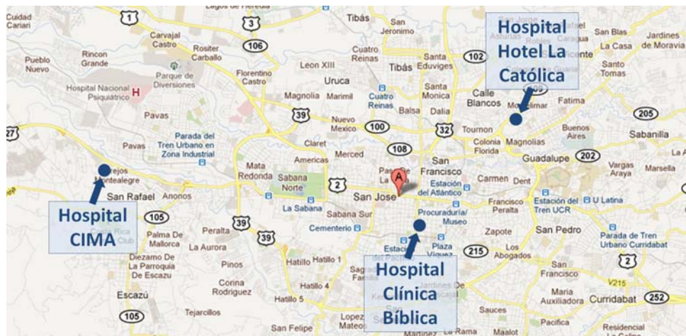
Mapa 5: Principales centros sanitarios privados de San José