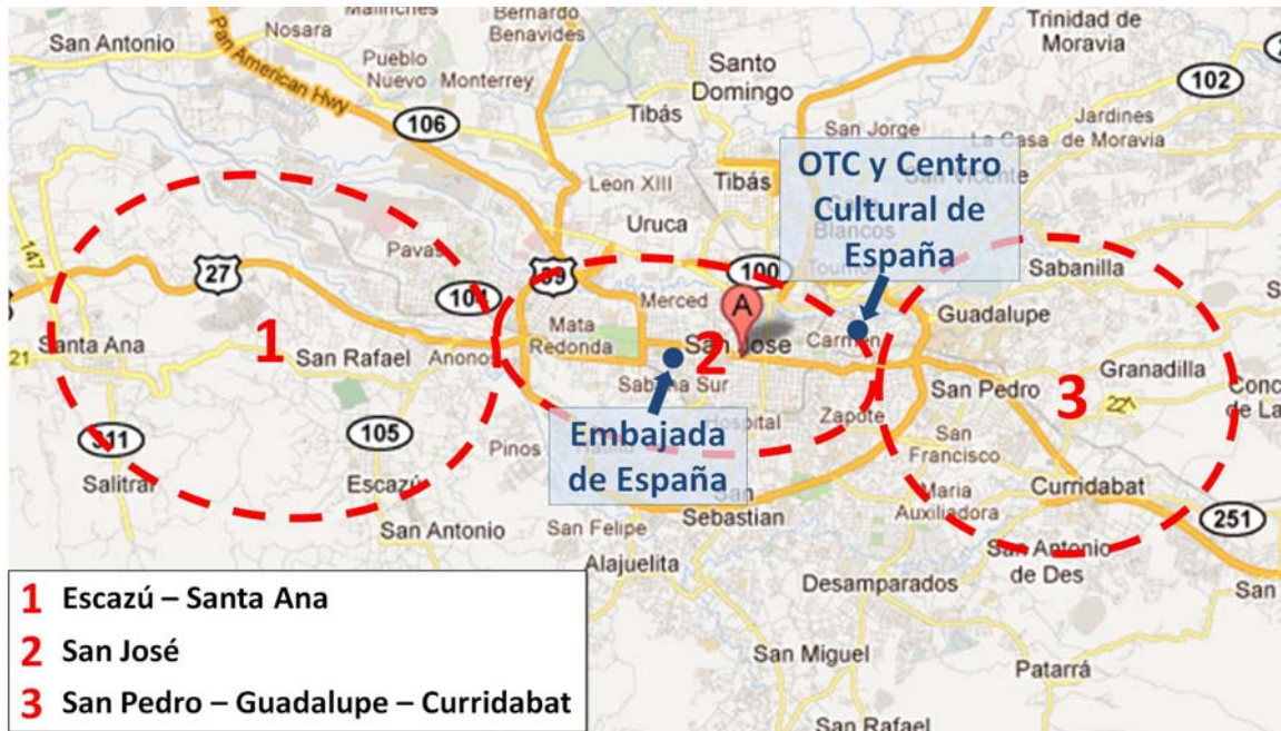
Mapa 3: General de San José (longitud en sentido oeste-este: unos 21 km)

Es conveniente saber que a pesar de no estar muy alejadas, existe una cierta diferencia de clima entre las zonas oeste y este, siendo algo más cálida (2 ó 3 grados) la primera.