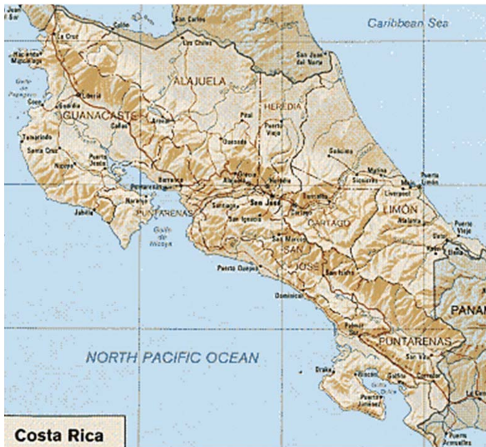
Mapa 1: Esquemático con relieve de CR

Costa Rica linda al norte con Nicaragua, al sur con Panamá, al este con el Mar Caribe y al oeste con el Océano Pacífico. La costa caribeña se extiende 255 Km, mientras que la costa pacífica tiene una longitud de 1.103 Km. Ambas costas cuentan con abundantes playas de primer nivel y una vegetación exuberante. Aunque la distancia aparente a la costa desde San José no es mucha, el tiempo que se emplea en llegar es más del previsible, debido al mal estado de las carreteras y a la existencia de muchos puertos de montaña.