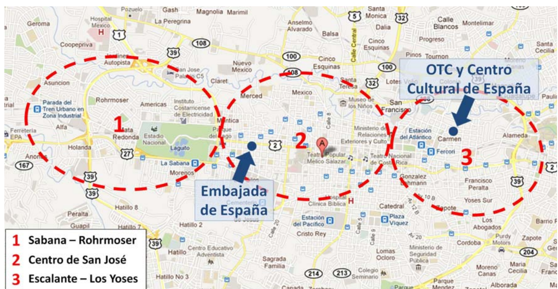
Mapa 4: Área central de San José (longitud en sentido oeste-este: unos 4 km)